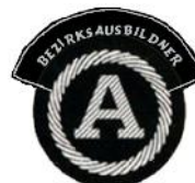
Ausbildner im Bezirk